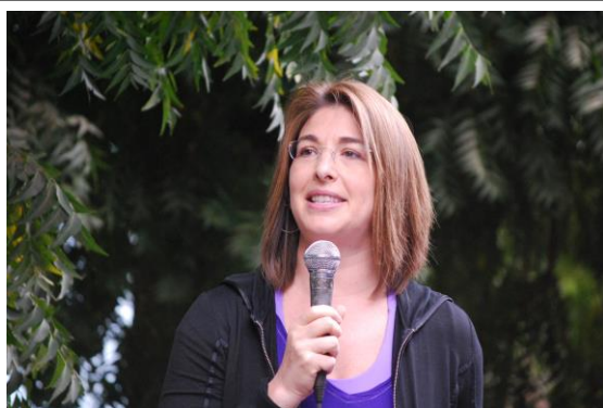
Naomi Klein, autrice di "NO LOGO"

I teorici del management, a metà degli anni Ottanta, propongono una rivoluzione: le aziende devono produrre principalmente marchi (logo) e non prodotti. Con questa teoria si invertiva la filosofia affermatasi fin dagli anni Trenta, quando gli analisti raccomandavano alle aziende la produzione di "cose", di beni materiali, per uscire dalla depressione. I precursori della nuova filosofia erano aziende come Nike, Microsoft, Tommy Hilfiger, Intel, le quali affermavano audacemente che il loro scopo principale era l'affermazione del loro marchio, mentre la produzione materiale dei beni poteva essere affidata in appalto oltre-oceano (cosa resa possibile dalle nuove regole del commercio internazionale e del mercato del lavoro). In definitiva, il branding (diffusione del marchio) diventava un imperativo: qualcosa di molto diverso e più complesso del semplice advertising (pubblicizzazione).